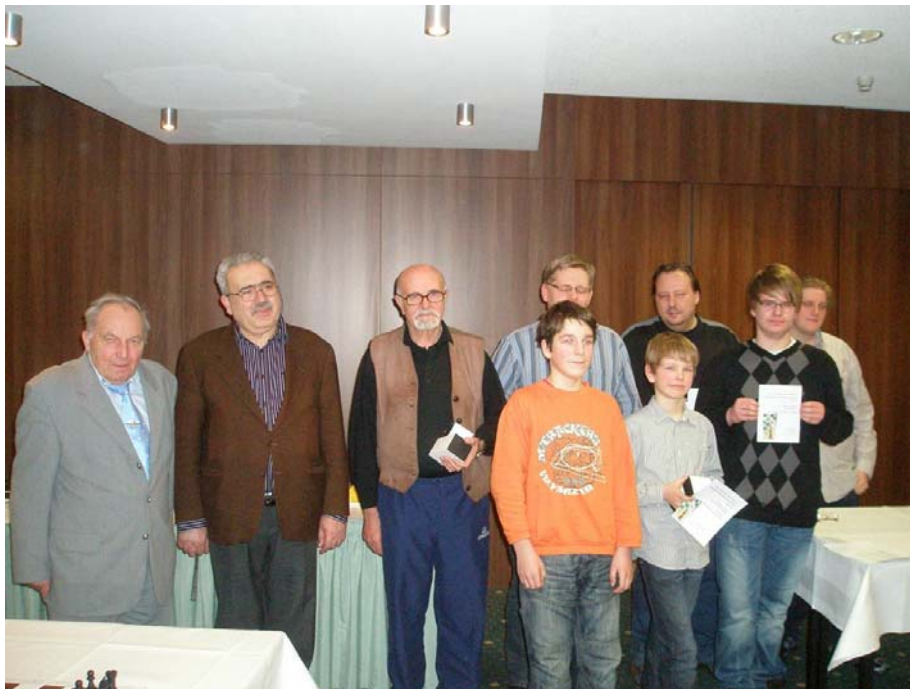
Siegerehrung der 1. Dresdner Teamwettbewerbe in den Kategorien "Seniorenteam", "Behindertenteam", "Kombination (Ausbildungsteam)" und "Freundschaftsteam"