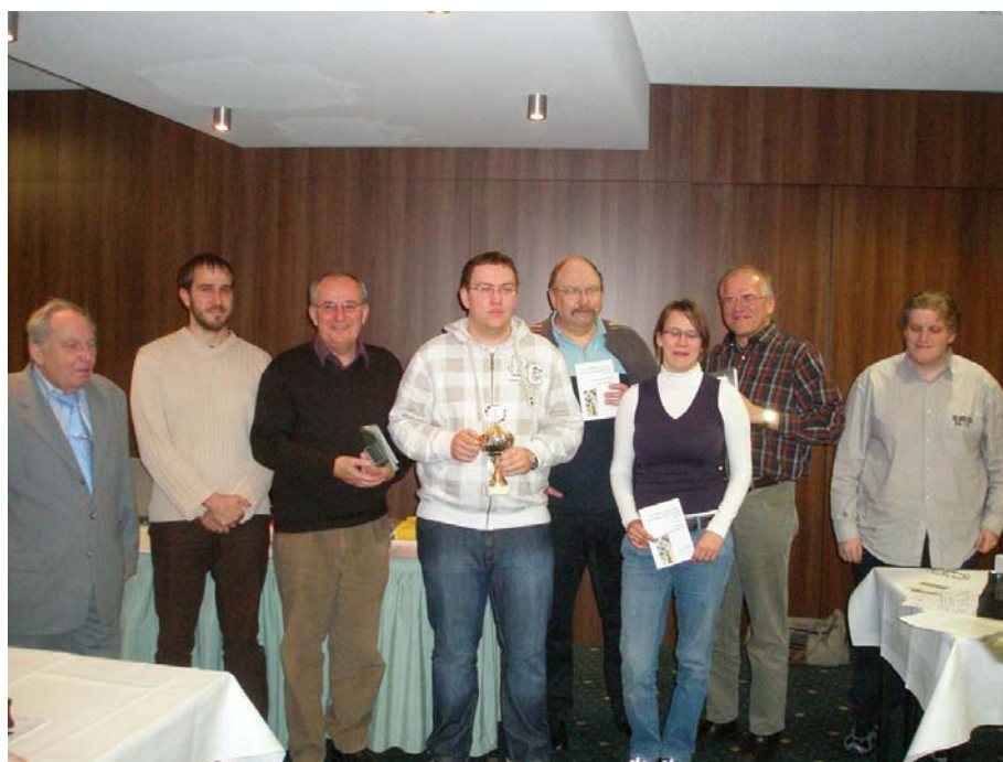
Siegerehrung der 16. Dresdner Familienmeisterschaft 2010