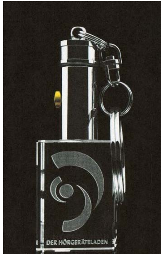
Der Schlüsselanhänger LSD von der Firma „Der Hörgeräteladen“, angefertigt von der Firma GLASFOTO.COM